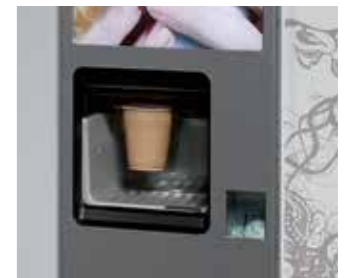
Ventana de recogida de producto Product collection outlet