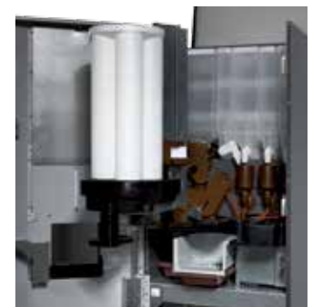
Capacidad para 250 servicios Capacity for 250 drinks