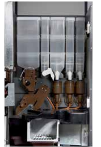
Detalle grupo de erogación y batidores. Wippers and bean-to-cup brewer.